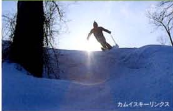
カムイスキーリンクス