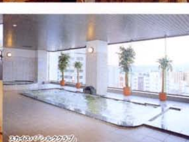
スカイスパ「シルフクラブ」