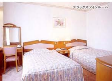
デラックスツインルーム