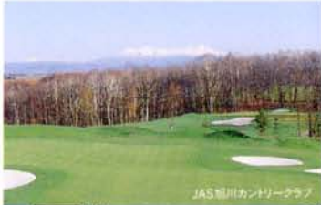
JAS旭川カントリークラブ

近隣には大雪の山々をはじめ豊かな自然が広がり、多くの観光名所はもちろん、さりげない風景やふれあいがあたたかい感動をふくらませます。自然の素顔につつまれながらのゴルフ場やスキー場も数多く点在。また、個性あふれる温泉の宝庫でもあり、四季折々に美しく、変化に富んだ表情で訪れる人々を魅了しています。ホテルから歩いて数分の「三六街」は、居酒屋、寿司店など約1,800軒が並ぶ飲食街。各官公庁や駅前の中心部へもホテルから徒歩圏内という便利さで、ビジネスや観光に絶好のロケーションです。「ホテルクレセント旭川」は北海道の旅の拠点として、心に残るこちよさをご提供いたします。