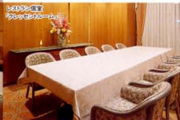
レストラン「個室」 「クレセントルーム」