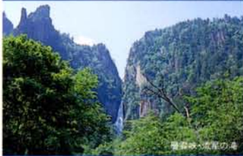
奥の細道・奥の湯