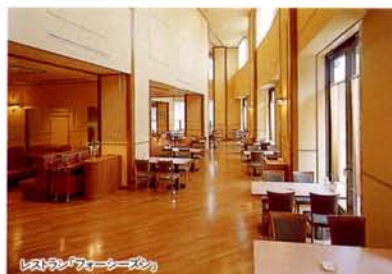
レストラン「フォーシーズン」